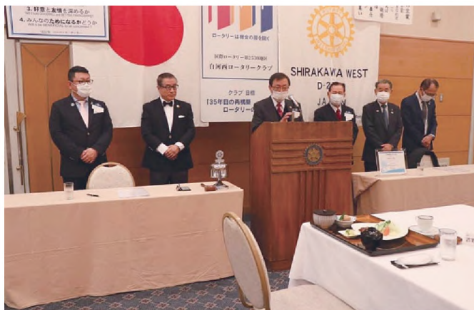
▲白河西RC 例会へ参加

場 所：白河西ロータリークラブ親善訪問 集合時間：午前8：30 埼玉グランドホテル深谷 当日内容：白河西 R C 昼食会に参加。次年度、白河西 R C 35周年記念行事打ち合わせ参加後、帰路