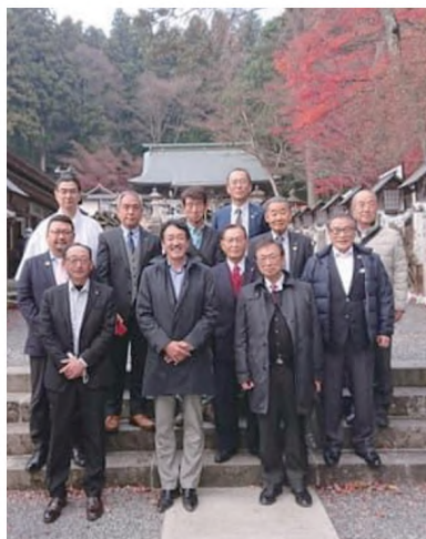
◀南湖神社へお参り